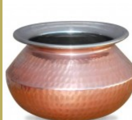
Bols de Table Handi Pour...